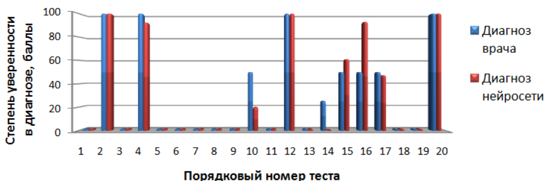
Рис. 1. Сопоставление диагнозов врача и нейросети заболевания «Стенокардия нестабильная». \varepsilon_p = 13,4\%

После обучения и оптимизации нейронной сети для окончательной проверки ее диагностических свойств использовалось подтверждающее множество ( P ), которое ни в обучении, ни в оптимизации нейросети не участвовало. Пример результатов проверки работы нейросетевой диагностической системы на множестве P для одного из заболеваний представлены графически на рис. 1 в виде сопоставления фактического диагноза, поставленного врачами-экспертами и диагноза, полученного в результате вычислений нейронной сети. Для обеспечения качества изображения на рисунках приведены только по 20 тестовых примеров. Значения среднеквадратичной погрешности \varepsilon_p , подсчитанные при диагностике каждого из шести исследованных заболеваний на множестве P , приведены в таблице 1.